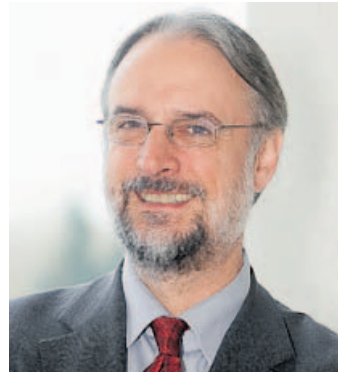
MP3-Erfinder Prof. Karlheinz Brandenburg.

Fakten: Bau der Berliner Mauer, Studentenbewegung, Kuba-Krise, Eiserner Vorhang, Vietnamkrieg, Contergan, Prager Frühling, Woodstock, Mondlandung, Ermordung von John F. Kennedy, Elvis