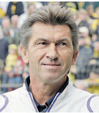
Ex-Clubtrainer Klaus Augenthaler.

Erstes Auto: Ein Opel Commodore vom damaligen Bayern-Präsidenten. Immer wenn es geregnet hat, ist das Auto stehen geblieben. (chb)