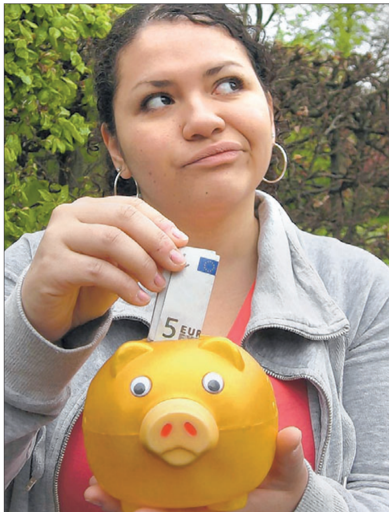
Futter fürs goldene Sparschwein: Sie überlegt noch – soll sie das Geld ins Schweinchen werfen oder doch lieber ausgeben?

Die Jugendredaktion verlost die Sachbücher „Der kleine Finanzcoach“ und „Mit Taschengeld zum Millionär“ am kommenden Dienstag, 21. April, zwischen 14 und 14.10 Uhr unter ☎ 0 79 31/5 96 77. jured