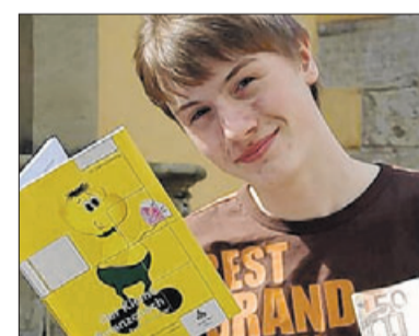
Max mit dem Finanzcoach.

Wer Tipps zum Umgang mit Geld erwartet, aber auch, wer sich über Finanzdinge informieren will, ist mit dem „Kleinen Finanzcoach“ Buch perfekt bedient. Schüler werden mit Gelddingen wie „Was kostet das Leben?“, „Versicherungen“, und „Rente“ konfrontiert. Ohne viele Fachbegriffe und sehr witzig erklärt „Der kleine Finanzcoach“