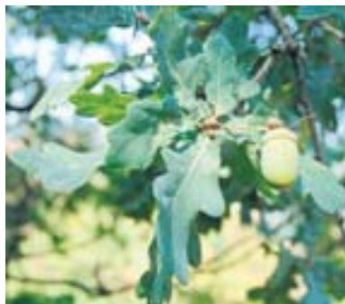
Hier kann man die Eichenblätter gut erkennen. Eine Eichel ist noch grün .