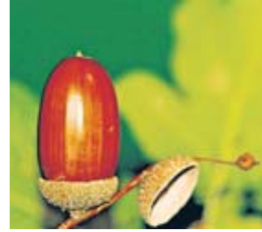
Eine Eichel aus der Nähe: braun und glatt, wie ein Ei mit einem Hütchen .

Mit Unterstützung der vier Sparkassen Goch-Kevelaer-Weeze, Kleve, Krefeld und Straelen machen 120 Kindergärten im linksrheinischen Kreis Kleve beim Waldmeister-Projekt mit. Weitere Infos zu jeder Folge finden Sie zusätzliches Material und Bilder auf: www.rp-online.de